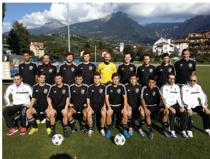
ALCUNE FORMAZIONI DELL'OLIMPIA HOLIDAY MERANO: LA PRIMA SQUADRA CHE MILITA IN 3.A CATEGORIA E, A FIANCO DEL TITOLO, IL TEAM DI CALCIO A 5; AL CENTRO GLI ALLIEVI PROVINCIALI E, SOTTO, I GIOVANISSIMI REGIONALI. PIÙ A DESTRA I GIOVANISSIMI PROVINCIALI E, SOTTO, GLI ESORDIENTI A 11